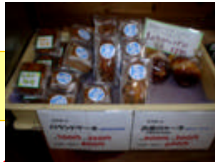
文旦シャーベットの、文旦特有の苦味を持味にそのままの味になるよう工夫しています。手作りのため果肉が入っていることもあります。