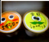
地元の文旦や土佐ジローの卵を使った職員手作りのアイス