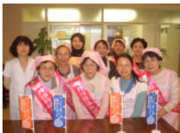
とさやまだファミリア 香美市食生活改善推進協議会土佐山田町支部の皆さん

地域の方々と連携されて、地産地消の定着に向けた取り組みの活動の輪を広げていただけることを期待しております。